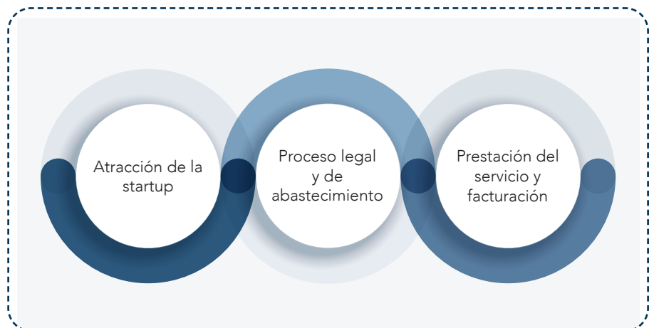
Figura 3. Síntesis del Journey. Relación comprador - vendedor

El proceso se resume en tres momentos, brindando un mayor detalle en la siguiente sección: