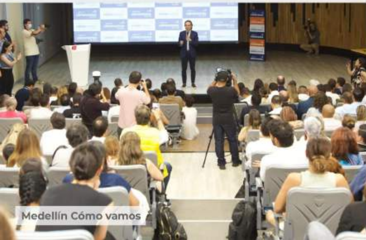
Medellín Cómo vamos

10 eventos y 9 estudios de interés ciudadano.