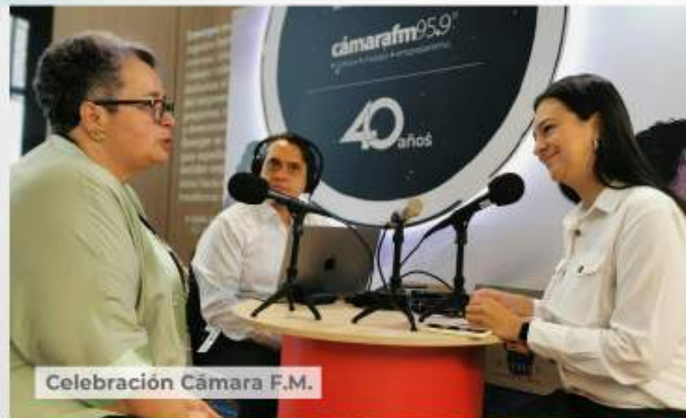
Celebración Cámara F.M.