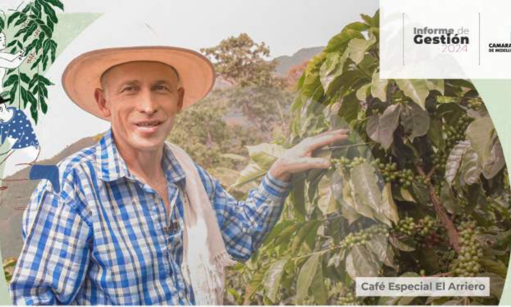
Café Especial El Arriero