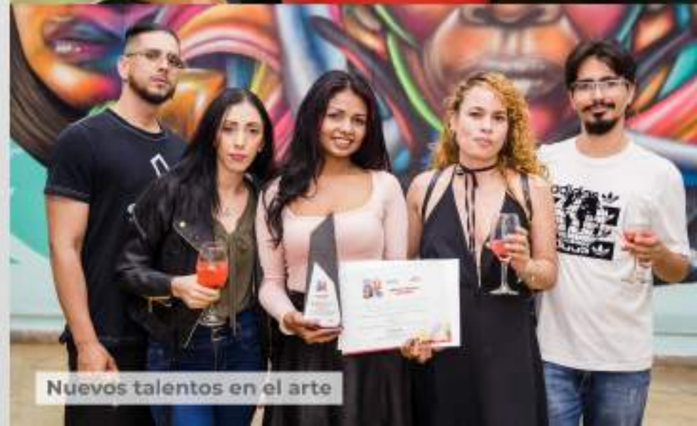
Nuevos talentos en el arte